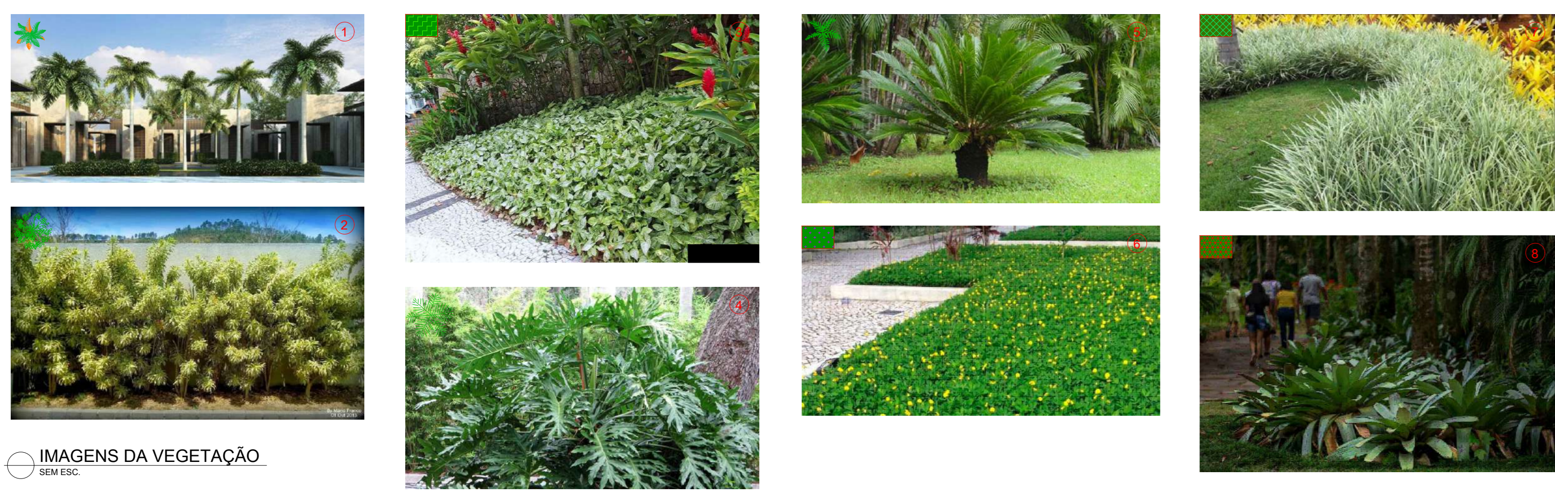
IMAGENS DA VEGETAÇÃO