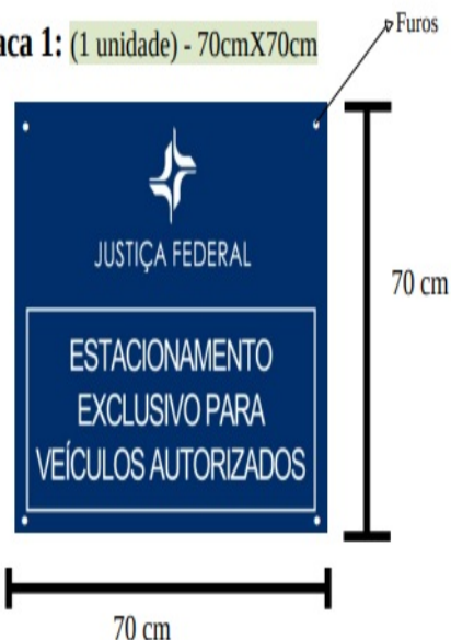
Placa 1: (1 unidade) - 70cmX70cm

Observação: Os modelos de referência de cada placa serão encaminhados à empresa vencedora, a qual deverá, posteriormente, enviar a arte desenvolvida para aprovação, antes da fabricação da placa.