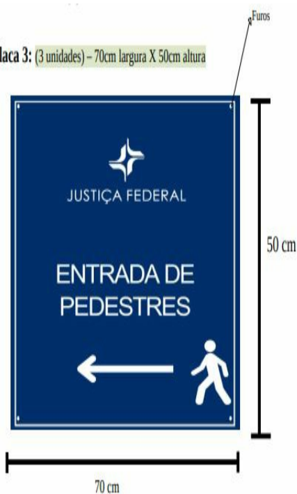
Placa 3: (3 unidades) - 70cm largura X 50cm altura

Observação: Os modelos de referência de cada placa serão encaminhados à empresa vencedora, a qual deverá, posteriormente, enviar a arte desenvolvida para aprovação, antes da fabricação da placa.