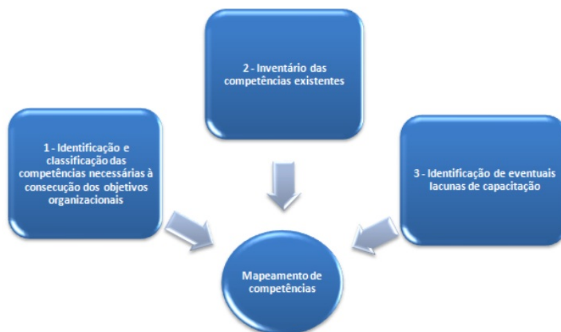
Figura 2: Processos do mapeamento de competências

O Mapa de Competências , registrado no PAe SEI 0017975-14.2025.4.06.8000, permite a identificação da lacuna ( gap ) entre as competências necessárias e as competências internas existentes para concretizar a estratégia da unidade.