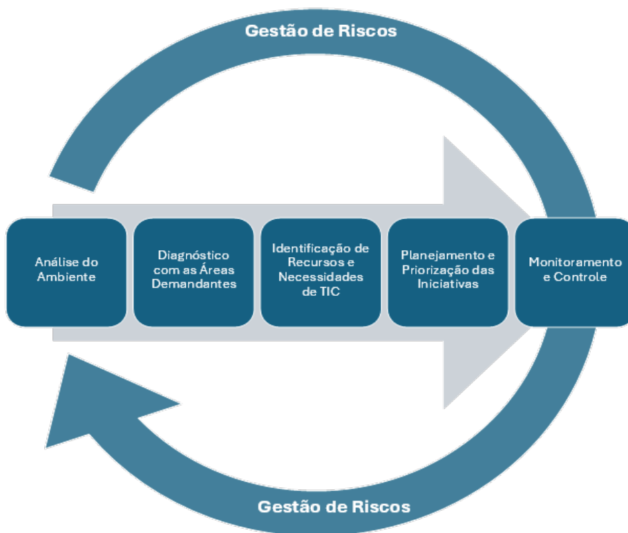
Figura 1 - Fluxo de Elaboração do PDTIC

Por fim, após sua Elaboração, o PDTIC seguirá o Fluxo de Aprovação em que será realizada a sua Revisão, Aprovação e Publicação. O PDTIC será objeto de revisões periódicas e ações de monitoramento contínuo, permitindo ajustes dinâmicos frente a mudanças internas e externas, e contribuindo para o alcance dos objetivos institucionais com maior eficácia, eficiência e efetividade.